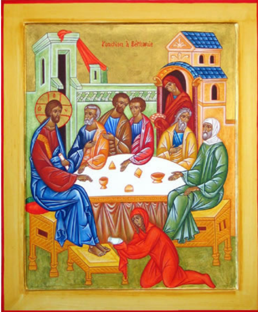
The sinful woman المرأة الزانية